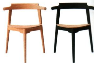
POINT OF VIEW CHAIR