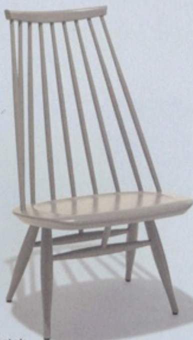
A2 — SWEDEN

長山智美 インテリアスタイリスト / 「Casa Brutus」 や「pen」などの雑誌のスタイリングを中心 に、カタログスタイリングや、ショップの内 装、家具の商品開発など多方面で活躍する。