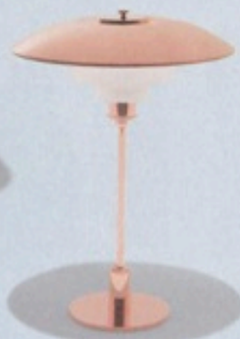
Louis Poulsen — DENMARK

1956年にイルマリ・タビオヴァーラがデザインした、エ レガントなスラットバックのラウンジチェア。「座面が 低いので座りやすい。北欧らしいセージグリーン色は白 い家具との相性もよく、インテリアの幅を広げてくれま す。」「マドモアゼル ラウンジチェア」 ¥130,200 (アル テック / アルテック ジャパン ☎03-6447-4981)