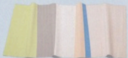
FREDERICIA — DENMARK

カラフルな色使いはデザイナー、ショル テン&パーイングスの得意技。「紙繊維 を編み込んでいるので軽くてコンパクト に丸められます。80×200cmのサイズも 日本の家にぴったり。裏面には滑り止 めコーティングが施されている。」「ペ ーパーカーペット」 ¥15,800 (ヘイ / hayu kanda ☎03-5295-0061)